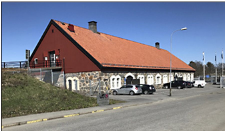
Ladugården, numera bl.a. bilverkstad.