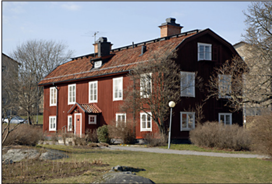
Apelberg var statarbostäder fram till 1930-talet. Numera är det gästrum till slottet.