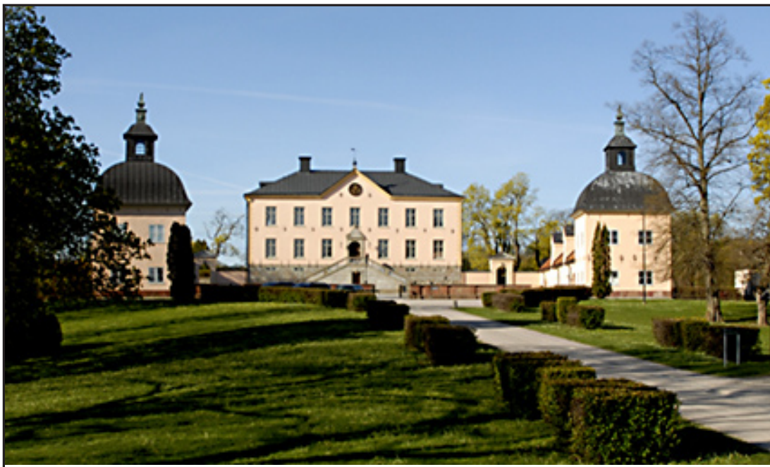
Hasselby slotts huvudbyggnad och flyglar.