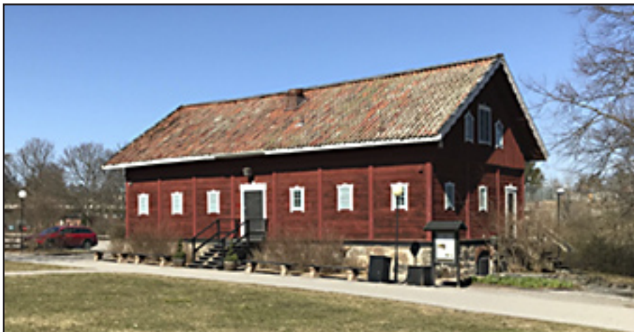
Plaisiren, spannmålmagasin från 1800-talet.